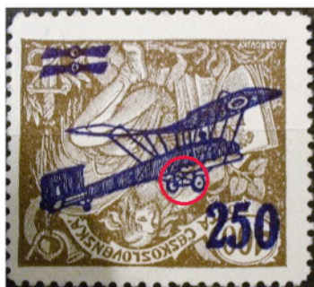
Obr. 1 Nepoužitá známka L6 PP s novou doskovou chybou v červenom krúžku

V katolígech je táto známka trese podrobenejšie. Z toho dôvodu je aj táto prevrátená pretač často falikovaná. Na obr. 1 je znázornená známka L6 PP na listovej sieti pri osvetlení jej prevrátený tlačiteľný vzor nápisu letiska v leteckej pretači. V leteckej pretači som našiel vzor pretače nastane – doľahy vystupujúci podsvietený letadla. Výzor časti pretače známky bez doskovej chyby (DCH) a výzor časti pretače s nápisom DCH je na obr. 2 (výzor s DCH je z leteckej obálky z obr. 4 – svetložltá farba pretače).