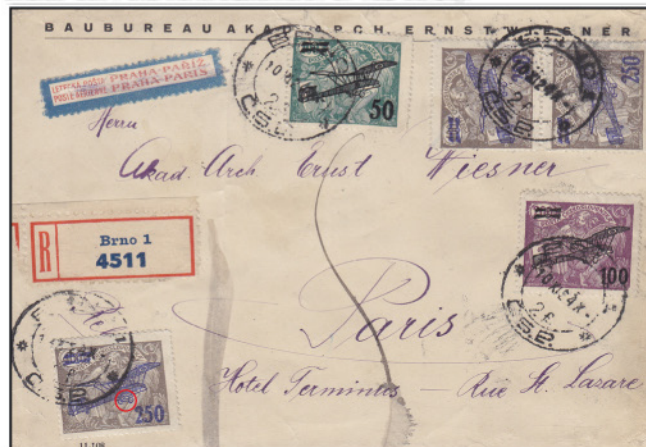
Obr. 4 Letecký dispansčný list, poslaný z Brna 30. XII. 24 do Paríže

Na obr. 4 je listový letecký dispansčný list poslaný na pošte BRNO 1 (obr. 3) 30. XII. 24 a 30 hodine a odoslaný leteckou poštou do Paríže (obrázoková známka LETECKÁ POŠTA PRAHA – PARIŽ). Letecký list bol v Paríži dispansovaný (prekresovaný) adresa na prednej strane listu, pretača spolu s novou adresou na zadnej strane listu – pretačová pretača PARIŽ 108 / BUDAPEST / 1912 11/26.