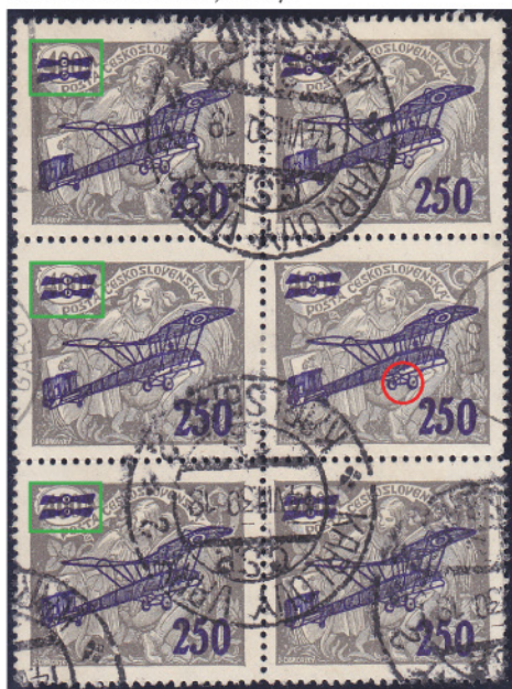
Obr. 3 Pánsky 6-blok známok (KARLOVY VARY 2. JAVNE 30) s doskovou chybou pretače (osvetlenie červeným krúžkom) sa nachádza na sieti neidentifikovanom známkovom poli s nápisom známok (DCH 50).

Nastalo hľadanie v mojom známkovom materiáli a nájdenie dvoch ďalších výskytov popisovanej doskovej chyby. K čiastočnej identifikácii pretačového známkového poľa s DCH pomohla jedinečná kombinácia spojených II. typov (tzv. široké nuly v nápisu 400) základnej známky 400h z emisie Hospodárstvo a veda 1920 a to na II. tlačovej doske medzi 5. a 6. riadkom tlačovej dosky.